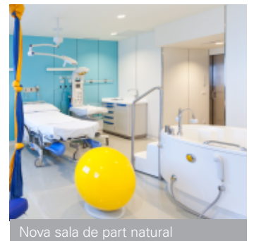
Nova sala de part natural