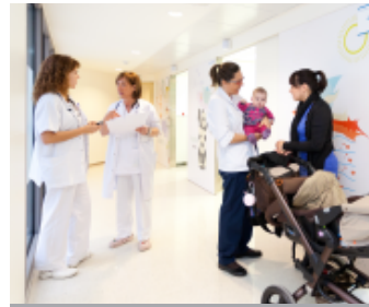
Nova àrea d'urgències pediàtriques