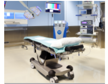
Quiròfans integrats d'alta tecnologia