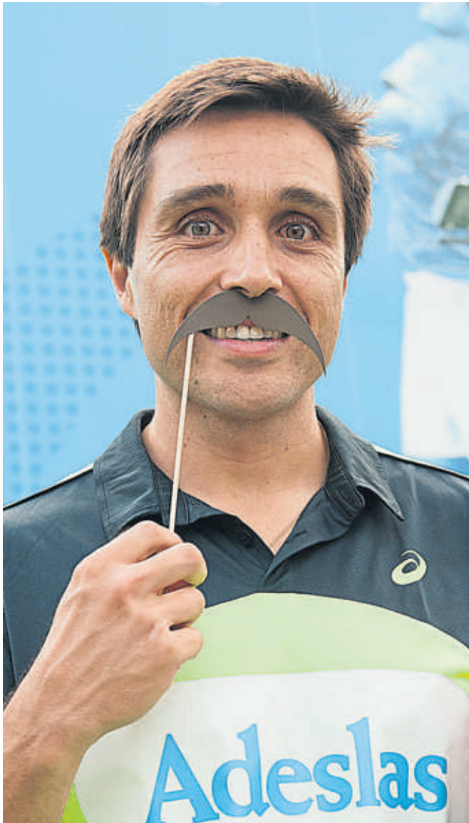
FERNANDO BELASTEGUÍN (PÁDEL)