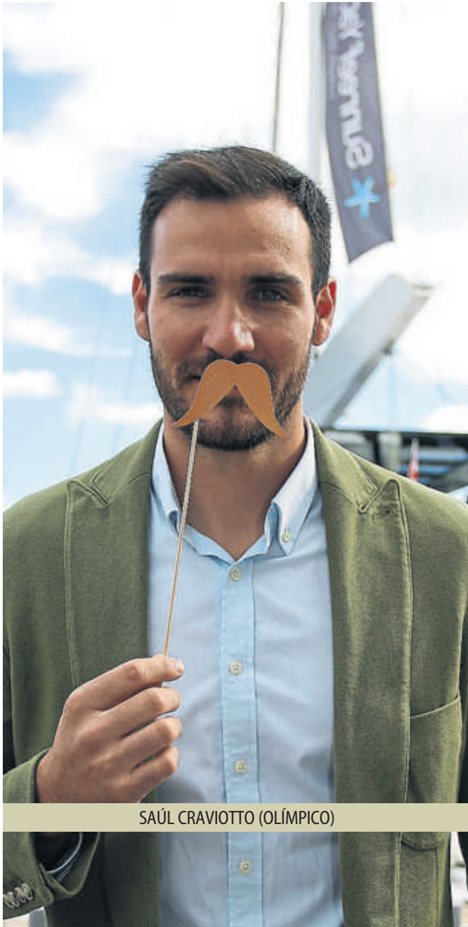
SAÚL CRAVIOTTO (OLÍMPICO)