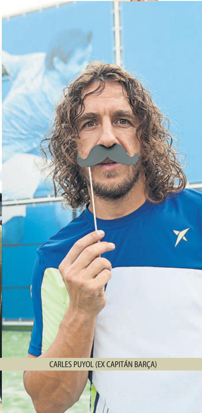
CARLES PUYOL (EX CAPITÁN BARÇA)