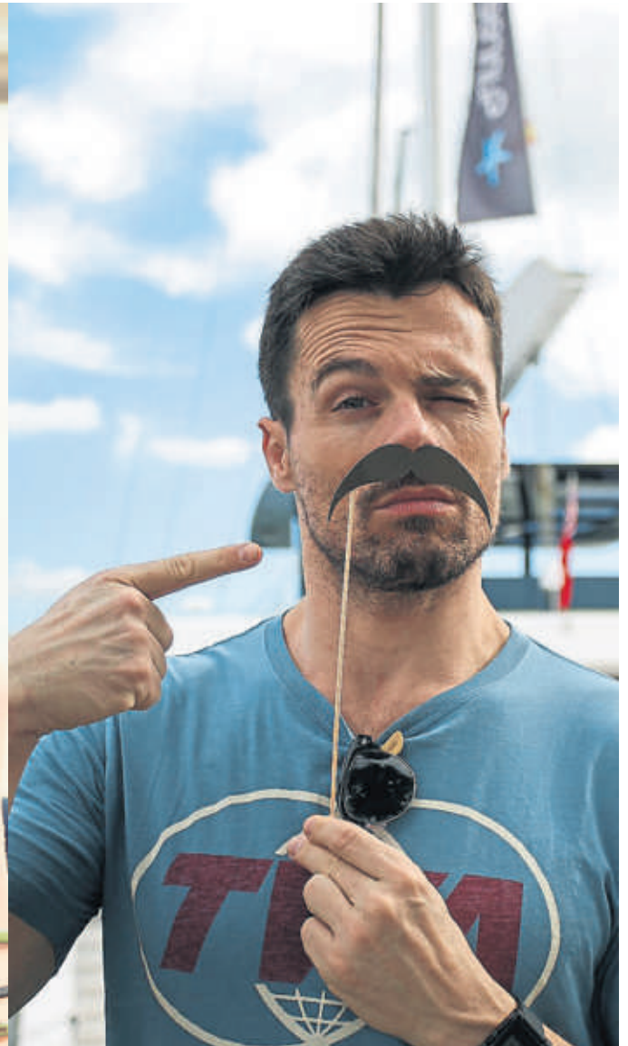
OCTAVI PUJADES (ACTOR)