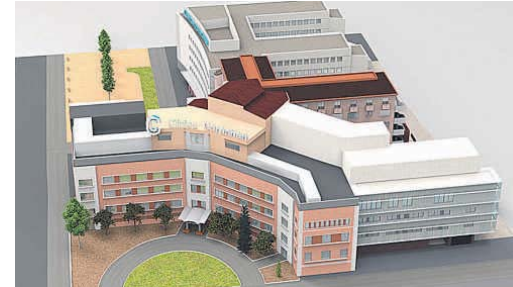
LA CLÍNICA CORACHAN, UN GRAN COMPLEJO HOSPITALARIO DE 40.000 M 2