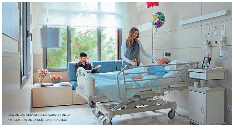
UNA DE LAS NUEVAS HABITACIONES DE LA AMPLIACIÓN DE LA CLÍNICA CORACHAN

Las cuatro nuevas salas de parto están también diseñadas para crear un ambiente cálido, cercano y familiar. Aspectos como la luz exterior y equipamientos como las camas hi-