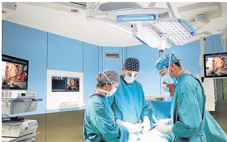
LOS QUIRÓFANOS INTEGRADOS DISPONEN DE MÚLTIPLES PANTALLAS DE ALTA DEFINICIÓN, EQUIPAMIENTOS Y LÁMPARAS LED SUSPENDIDAS DEL TECHO

El nuevo edificio Corachan IV, con sus 12.955 m 2 , consolida a la Clínica Corachan como un gran centro hospitalario completo e integrado, en el que se ofrece un servicio sanitario de alta calidad. Sus instalaciones –que ya alcanzan los 40.000 m 2 –, están provistas de tecnología punta y ofrecen el máximo confort y seguridad a pacientes, familiares, médicos y personal asistencial. Los profesionales de su completo cuadro médico realizan diagnósticos, tratamientos e intervenciones quirúrgicas hasta la más alta complejidad en todas las especialidades médicas