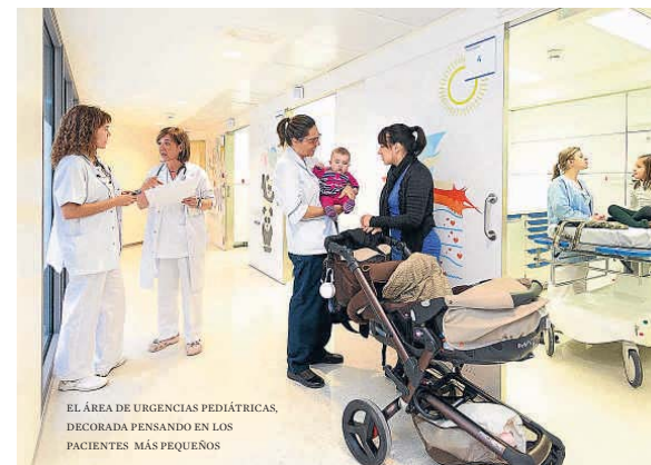
EL ÁREA DE URGENCIAS PEDIÁTRICAS, DECORADA PENSANDO EN LOS PACIENTES MÁS PEQUEÑOS